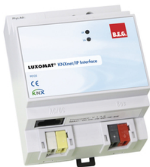
белый Ссылка 90125