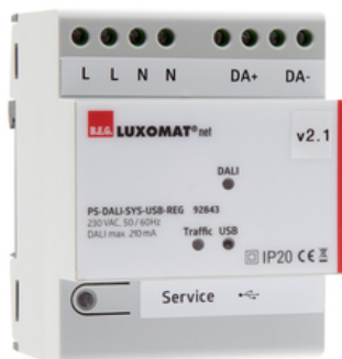
белый Ссылка 92843